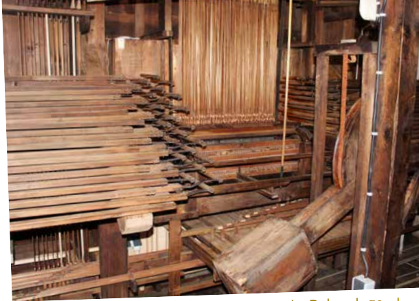
Registerwerk, im Vordergrund Gegengewicht Balganlage